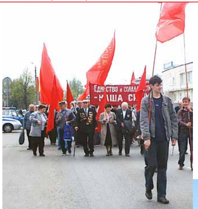
Первое Мая в Коломне