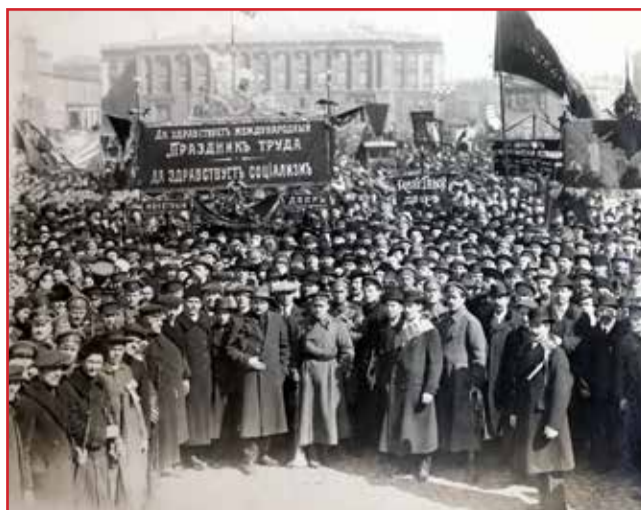
Петроград. Первое Мая 1917 года

- Правительство национальных интересов – будущее России!