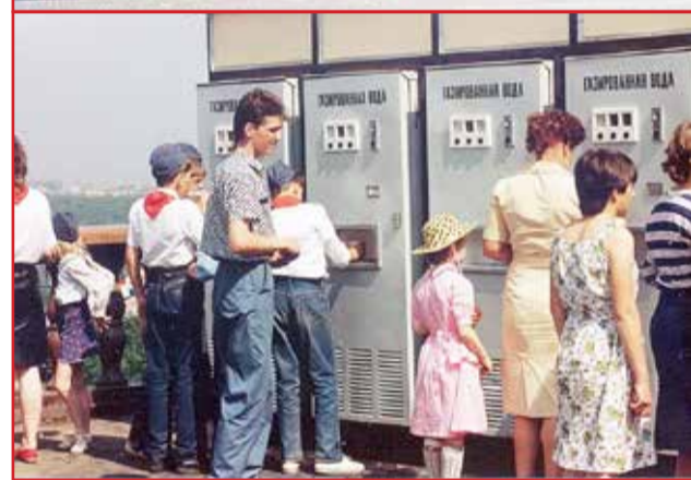
Стакан воды с сиропом в жаркий майский день. (3 коп.)