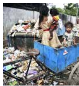
Какао и дети