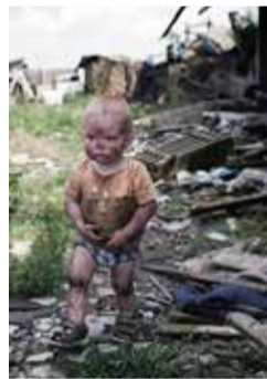
«Сепаратист» из Донбасса

Этот праздник возрождён усилиями КПРФ пионерии, на который