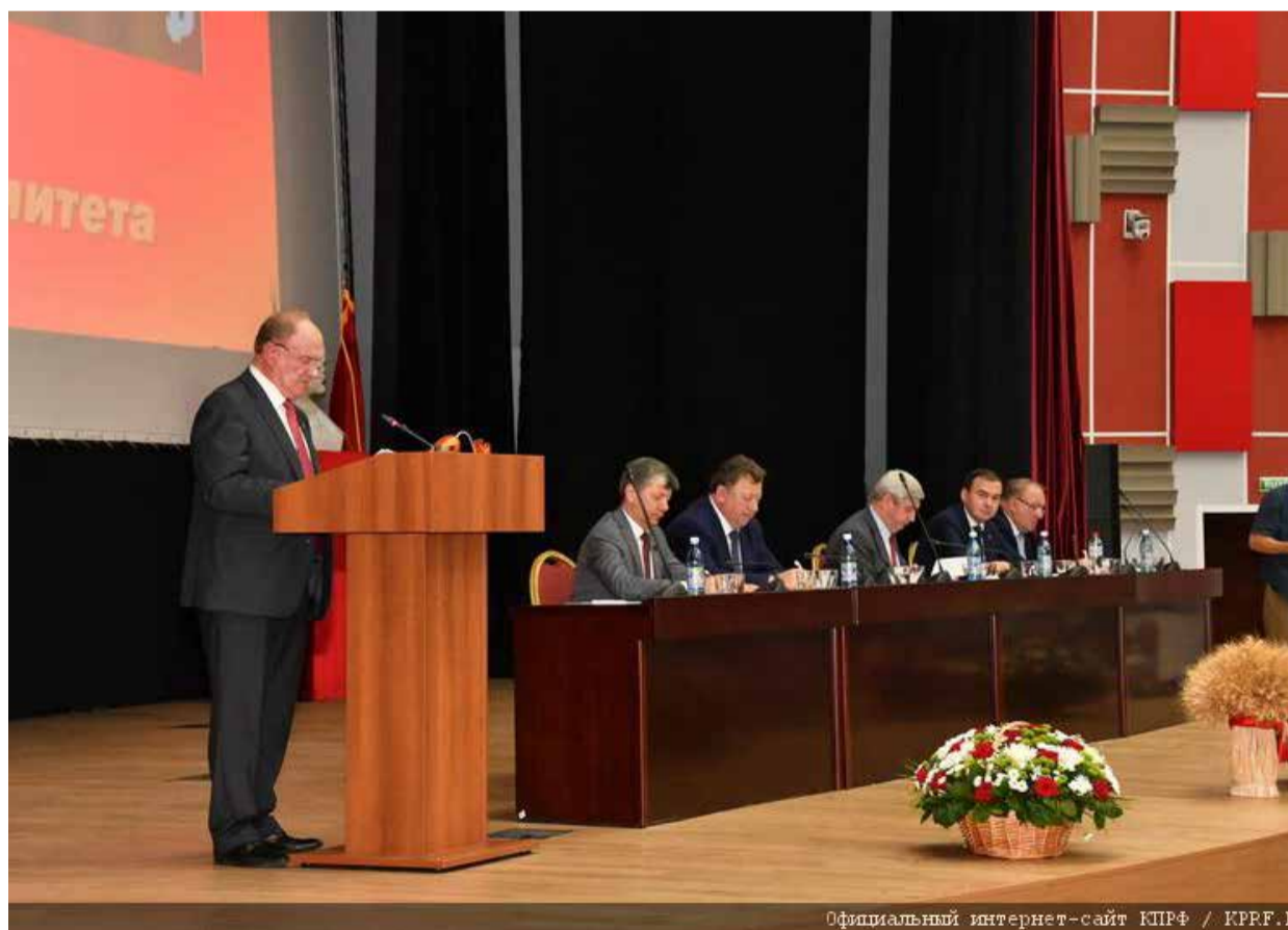
Официальный интернет-сайт КПРФ / KPRF.RU

В заключительном слове Председатель ЦК КПРФ Г.А. Зюганов отметил, что предложенная правительством «реформа» пенсионной системы является «последним выстрелом в лучшую социальную систему в мире, которая нам досталась в наследство от СССР». Он считает, что такая «реформа» наносит сильнейший удар по стабильности и по целостности в стране.