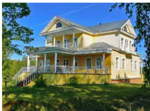
А у Черёхина свой путь и свой Устав.