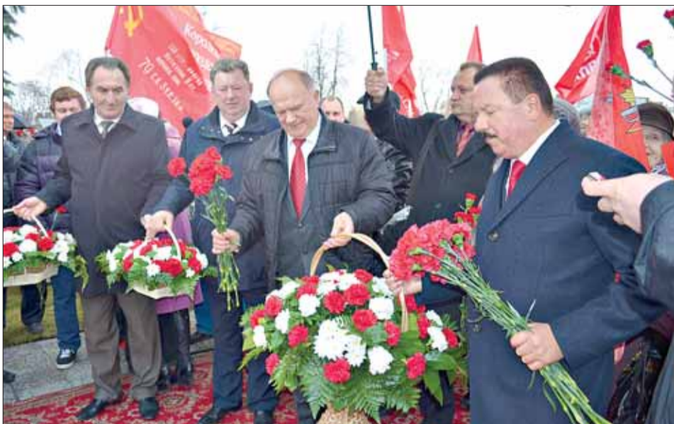
Возложение цветов к памятнику В.И. Ленина 17 апреля во время рабочего визита Председателя ЦК КПРФ Геннадия Зюганова на митинге, посвящённом торжественному открытию его после реконструкции.

22 апреля в честь 145-летия со дня рождения Владимира Ильича Ленина королёвские коммунисты возложили цветы к его памятнику. На встрече собралось более 30 человек – это коммунисты городского комитета, члены общественных организаций, просто прохожие. Для нашего города В.И. Ленин и память о нём имеют особый смысл. В трудные для орудийного завода в Подлипках времена именно В.И. Ленин помогал решить жилищные и кадровые вопросы завода. В начале 1921 года В.И. Ленин подписал Постановление СНК РСФСР о создании научно-исследовательской организации по разработке ракет и ракетных двигателей, давшее начало развитию ракетно-космической отрасли.