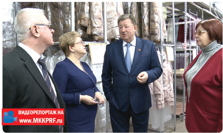
ВИДЕОРЕПОРТАЖ НА www.MKKPRF.ru