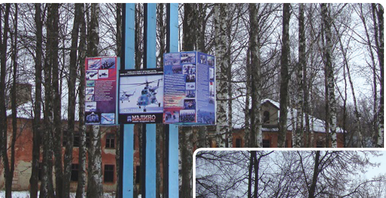
Президенту РФ В.В. Путину