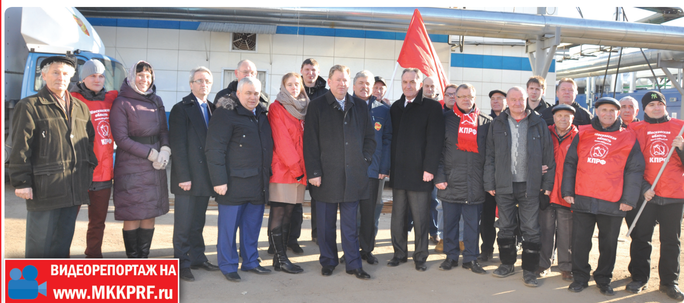
ВИДЕОРЕПОРТАЖ НА www.MKKPRF.ru