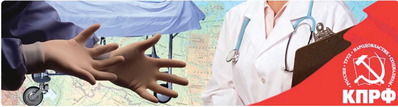
Окончание. Начало на с.1

Правительство постепенно переводит медицинские услуги на платную основу. В настоящее время доля платной медицины доходит уже до 60%. Только за 2015 год объем платных услуг вырос на 24%. Постоянно снижается количество граждан, получающих лекарства бесплатно: в 2014 году их количество снизилось на 165 тысяч человек, только 15% граждан бесплатно получают лекарственные препараты. В России самые низкие в Европе расходы на здравоохранение: в 2016 году - менее 3,6% от ВВП. Причем в последние годы прослеживается целенаправленная динамика снижения финансирования медицины. В 2015 году расходы сократились на 18%, а в 2016 году - еще на 15%. В результате за последние два-три года они уменьшились на треть.