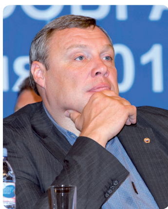
Окончание. Начало на с.1

Сейчас в различных секциях клуба тренируется около 10 тысяч человек. Все дети, а их в нашем составе более половины, занимаются бесплатно. Они имеют возможность совершенствовать свое мастерство в 29 видах спорта, таких как футбол, хоккей, бокс, греко-римская борьба, баскетбол, фигурное катание, теннис, лыжные гонки, легкая и тяжелая атлетика... В распоряжении физкультурников и спортсменов находятся прекрасные современные спортивные сооружения. Еще в 2000 году был введен в строй действующих ледовый дворец спорта «Витязь». С открытием современной спортивной арены была создана крепкая и надежная база, которая и по сей день постоянно и планомерно расширяется и совершенствуется. След за дворцом спорта были построены учебно-тренировочный корпус, теннисный комплекс с закрытыми и открытыми кортами, стадион, сейчас возводится бассейн. Так был заложен основательный фундамент для впечатляющих свершений подольских «витязей» как в сфере массовой оздоровительной физкультуры, так и в области спорта высших достижений.