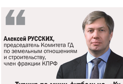
Алексей РУССКИХ, председатель Комитета ГД по земельным отношениям и строительству, член фракции КПРФ

В перерывах между играми ребята из военно-патриотического клуба «Воин» провели показательные выступления, продемонстрировали основы самообороны, а также сборку и разборку