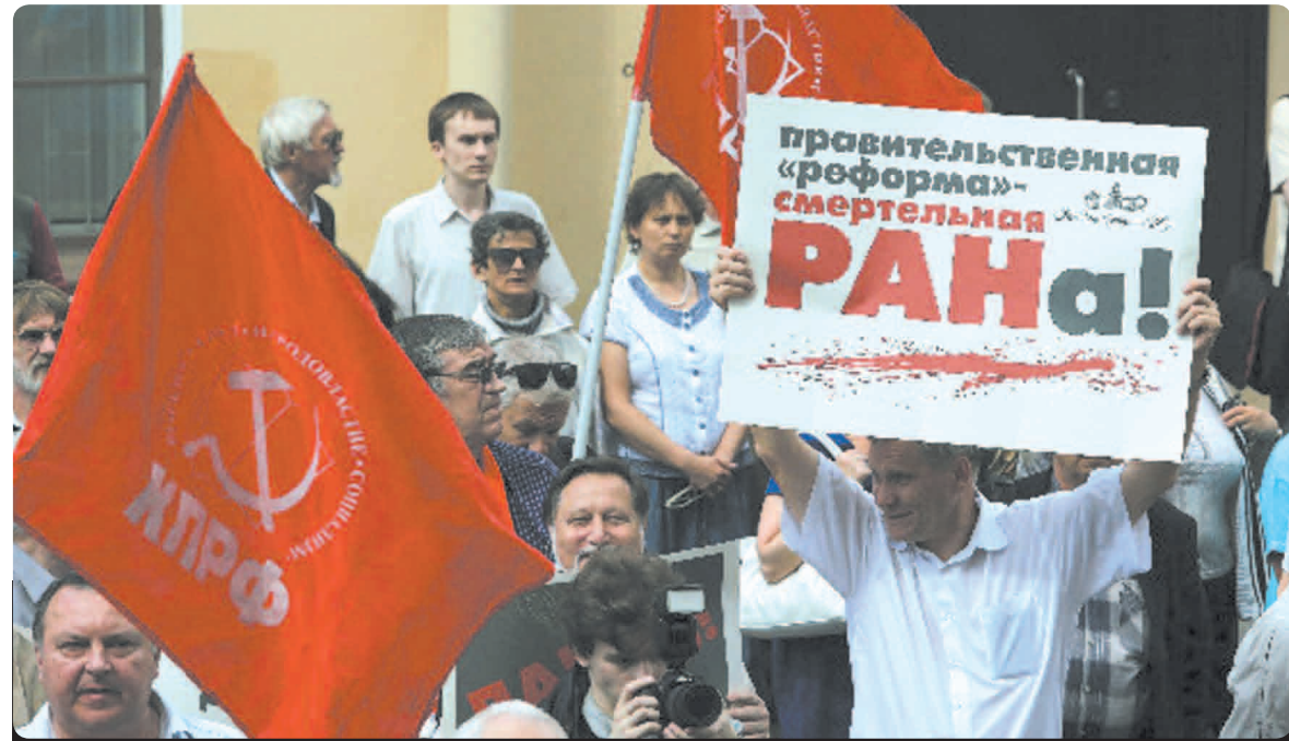
Над РАН снова сгущаются тучи. Как и пару лет назад, опять ползут мрачные слухи, подкрепляемые туманными пока заявлениями заинтересованных лиц о вероятности очередных преобразований, которые могут привести к значительному, в разы, сокращению числа ученых, т.е. специалистов высшего уровня, призванных расширять горизонты познания мира.