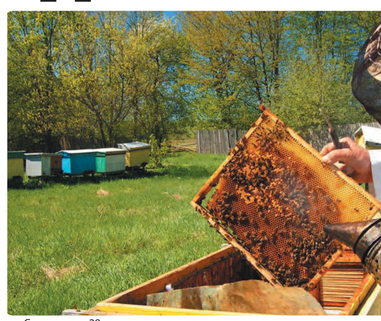
Согласно ст. 28 проекта, сотрудники ГИБДД обяжут «оказывать содействие беспрепятственной перевозке пчел», а при необходимости и организовывать сопровождение пчел к пунктам их назначения. Депутаты предлагают запретить задерживать транспорт с пчелами на срок более 15 минут.

По сравнению с законопроектом, внесенным в Думу в 1997 году, например, изменились права на улетевший пчелиный рой. Если ранее предполагалось, что улетевший рой в случае его слета с другой объявлялся общей собственностью владельцев, далее свальный рой делился пчеловодами на части, право собственности на часть определялось жеребьевкой, то теперь улетевший рой, вошедший в чужой улей с пчелами, становится собственностью владельца улья. А улетевший рой, не преследуемый