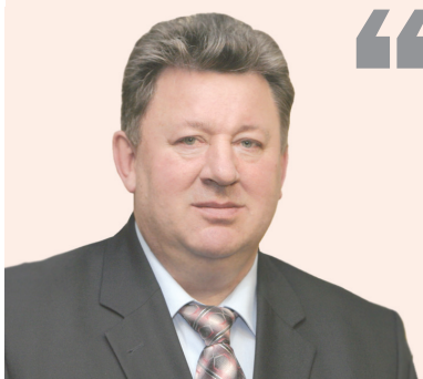
Владимир КАШИН, заместитель Председателя ЦК КПРФ, Председатель Комитета по природным ресурсам, природопользованию и экологии Государственной Думы РФ, академик РАН

« - Одним из главных направлений работы Компартии является поддержка тех, кто трудится на земле. Совхоз имени Ленина - это сельхозпредприятие, которое выживало и выживает в экстремальных условиях. Здесь все достойно трудятся, получают хорошую зарплату.