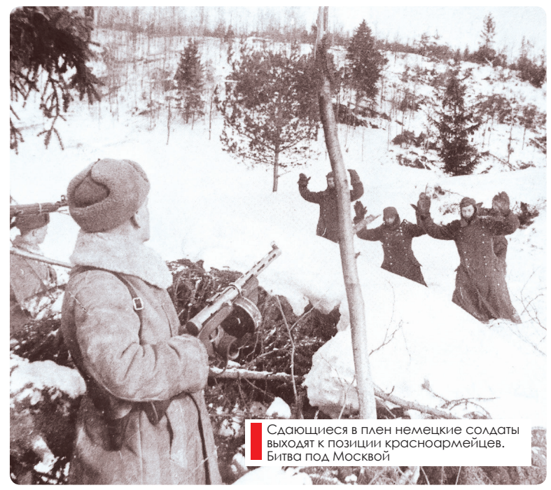
Сдающиеся в плен немецкие солдаты выходят из позиций красноармейцев. Битва под Москвой

Верблик. Немецкие танки в город не прошли. На следующий день 29-я и 50-я стрелковые бригады отбросили немцев на западный берег канала. А уже 1 декабря из района Дмитров - Перемиловка в наступление перешла вся 1-я ударная армия с задачей атаковать в направлении Деденево - Федоровка - Клин и создать благоприятные предпосылки для последующего разгрома всей клинско-солнечногорской группировки противника, став фактически первым советским соединением, перешедшим уже не в контратаку, а в планомерное контрнаступление на вверенном участке фронта.