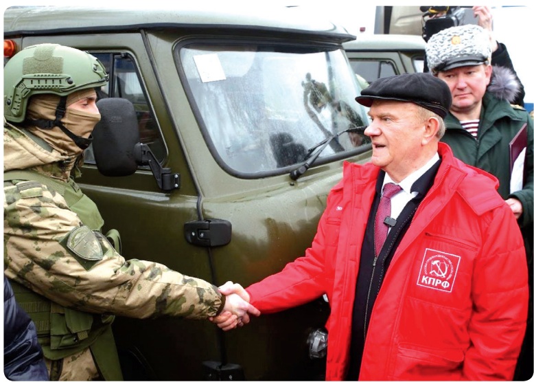
Окончание. Начало на с. 1